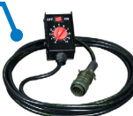
Optional BOX HF